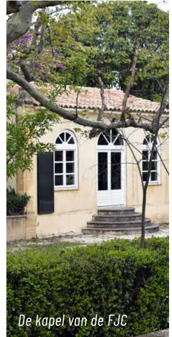
De kapel van de FJC