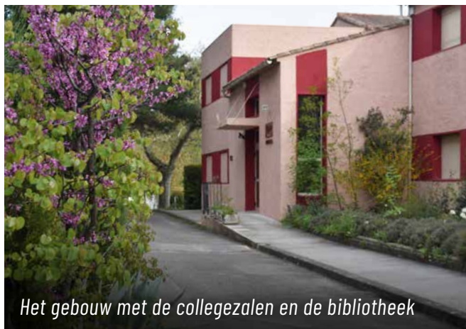
Het gebouw met de collegezalen en de bibliotheek

IN ZUID-FRANKRIJK STAAT SINDS 1974 EEN THEOLOGISCHE FACULTEIT VAN GEREFORMEERDE SIGNAATUUR, DE FACULTÉ JEAN CALVIN (FJC). DEZE OPLEIDING LEIDT STUDENTEN OP VOOR ALLE FRANSTALIGE PROTESTANTSE KERKEN WERELDWIJD. JAARLIJKS STUDEREN ER MEER DAN 100 STUDENTEN, TER PLAATSE OF VIA AFSTANDSONDERWIJS.