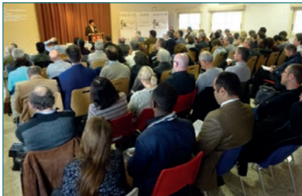
Goed bezocht congres over de Reformatie

Elk jaar organiseert de Faculté Jean Calvin in februari of maart een theologisch congres voor studenten en andere belangstellenden. In dit jaar van het jubileum van de Reformatie wilden wij graag een eigen geluid laten horen. Daarom kozen we voor wat Luther zelf als kern van het evangelie zag: de rechtvaardiging door het geloof alleen. Met als toespitsing: de verhouding tussen geloof en werken.