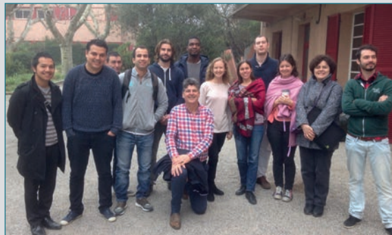
De eerste maandag na de stage