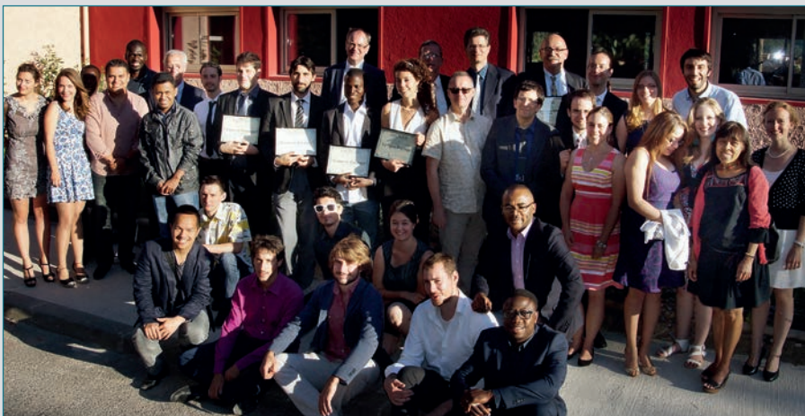
De diplomauitreiking 17 juni 2016